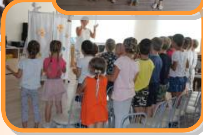
«День Рождения Медведицы»