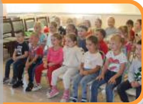
«Доктор Айболит в гостях у лесных зверей»