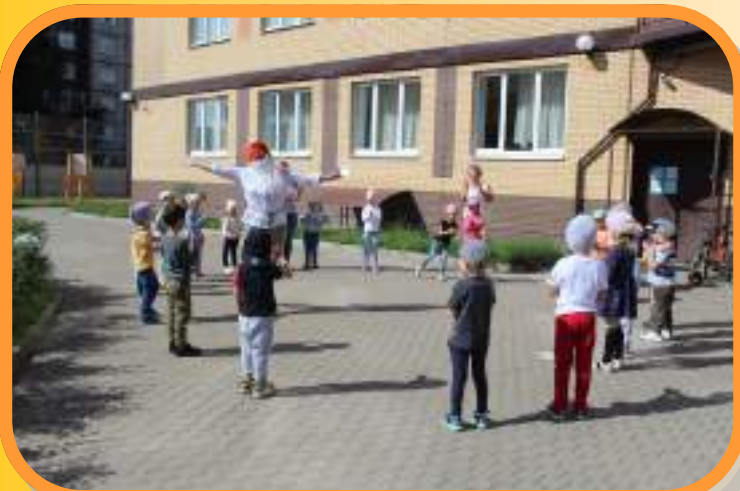
Лето красное пришло, всем веселье принесло! Будем летом отдыхать, песни петь и танцевать!

Ребята группы «Топотушки» отправились на веселом паровозике в путешествие «В гости к Лету»! На остановках ребят встречали сказочные герои – Лесной Гном, Солнышко! А на конечной остановке – долгожданное Лето!